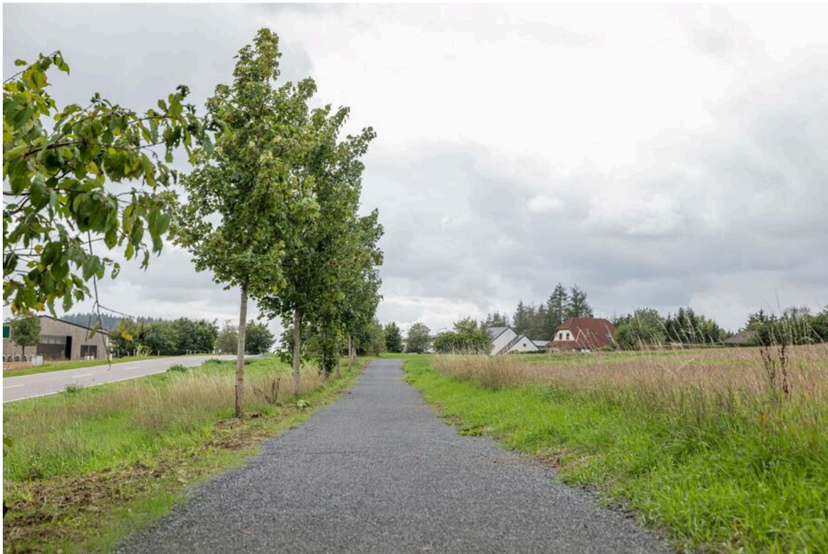
Barrierefreier Komfortwanderweg in Daleiden